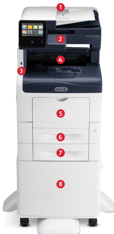
Stampante multifunzione a colori Xerox® VersaLink® C405 Stampa. Copia. Scansione. Fax. E-mail.