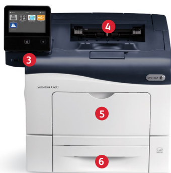
Stampante a colori Xerox® VersaLink® C400 Stampa.