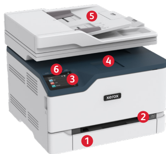
Stampante multifunzione a colori Xerox® C235