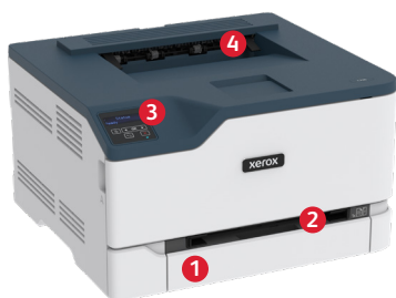
Stampante a colori Xerox® C230