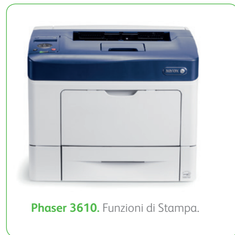
Phaser 3610. Funzioni di Stampa.