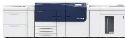
Stampante Xerox® Versant® 2100