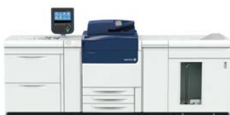
Stampante Xerox® Versant® 80

Potete permutare la vostra vecchia stampante con la stampante Xerox® Versant® 80, la stampante Xerox® Versant® 2100 o le stampanti Xerox® Colour 800i/1000i e usufruire in tal modo di una gestione del colore omogenea e affidabile. Potrete contare su una qualità del colore straordinaria in modo rapido e semplice, migliorando la vostra produttività e redditività lavoro dopo lavoro.