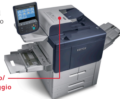
Alimentatore automatico/ scanner a singolo passaggio

Funzioni per l'ufficio quali l'alimentatore automatico/scanner a singolo passaggio, in grado di scansire in bianco e nero o a colori alla velocità massima di 270 immagini al minuto rendono al contempo PrimeLink una potente stampante per gruppi di lavoro e un vero e proprio sistema di stampa di produzione.