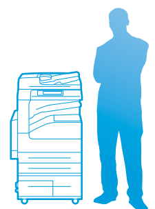
WorkCentre 5335 con vassoio tandem ad alta capacità