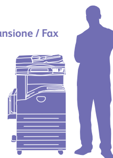
WorkCentre 5230 con modulo a due vassoi