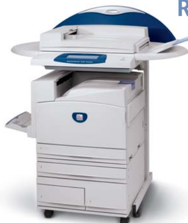
WorkCentre Pro 2636