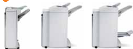
Stazione di finitura Office