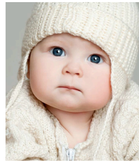
Nuova finitura Matt Dry Ink con produttività iGen4®