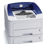
Phaser 3250 con vassoio 2 opzionale