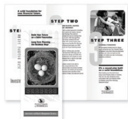
Piegatura doppia, a C e a Z