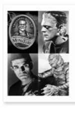
SquareFold Trim Booklet