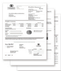
Bollette ed estratti conto