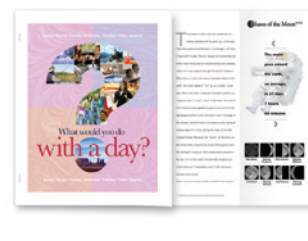
Inserti a colori, pinzatura e piegatura a Z ridotta